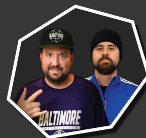
LAURENT ET LES TRUANDS