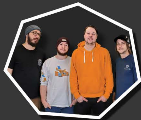
LE BINGO LE PLUS FOU AU MOONDE!

NOUS SOMMES FORTEMENT PORTÉS SUR L'APPLICATION DE RABAIS (ÉCONOMIE D'ÉCHELLE) SELON L'IMPORTANCE DES ACHATS. FAITES-EN LA DEMANDE À VOTRE CONSEILLER PUBLICITAIRE.