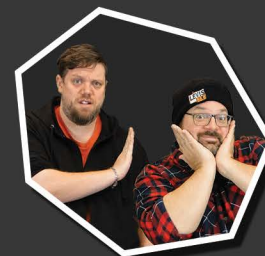
LES DEUX SNOOZES