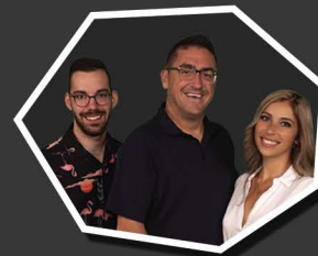
LE PARTY 969