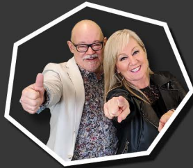
LES HITS DU VENDREDI- SAMEDI