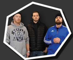
LE BLOC HIP-HOP

POUR RECHERCHE D'EMPLOYÉS, NOUS OFFRONS JUSQU'À 20% DE DIFFUSIONS SUPPLÉMENTAIRES!